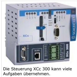
Die Steuerung XCc 300 kann viele Aufgaben übernehmen.