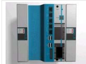
Viel Leistung bringt die neue Schleicher-Steuerung XCx 1100.

Mit der XCx 1100 liefert Schleicher eine schnelle Steuerung, die bis zu 64 interpolierende Achsen, mit optionalen Controllern auch bis zu 128 Achsen. Das System kombiniert eine Motion-Control-Steuerung, eine CNC und eine SPS nach IEC 61131. Bei Bedarf kann der Rechner Visualisierung und eine Bedienoberfläche unter MS Windows betreiben.